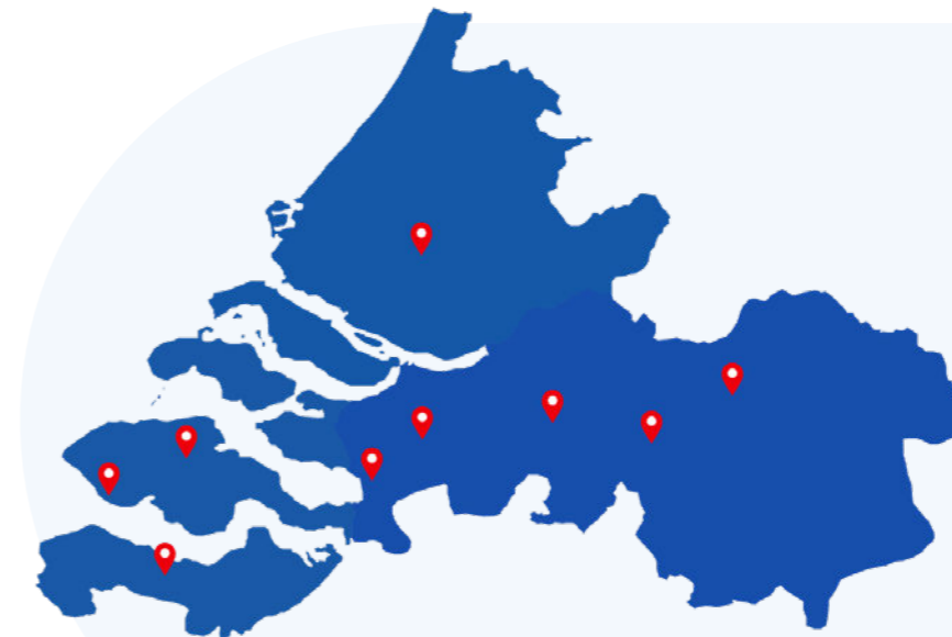
Aangesloten ziekenhuizen: Admiraal de Ruyter Ziekenhuis, Amphia, Bravis ziekenhuis, Erasmus Medisch Centrum, Elisabeth-TweeSteden Ziekenhuis, Jeroen Bosch Ziekenhuis, ZorgSaam, Zuidwest Radiotherapeutisch Instituut.

van een patiënt naar voren zijn gekomen. Hierna wordt overeenstemming bereikt over de diagnose en het verdere beleid. Meestal is dit een behandelplan, maar bij sommige patiënten is er extra onderzoek nodig. Als instituut participeren we in alle multidisciplinaire overleggen en tumorwerkgroepen van de ziekenhuizen waarmee we samenwerken. In 2021 vonden de MDO's noodgedwongen digitaal plaats.